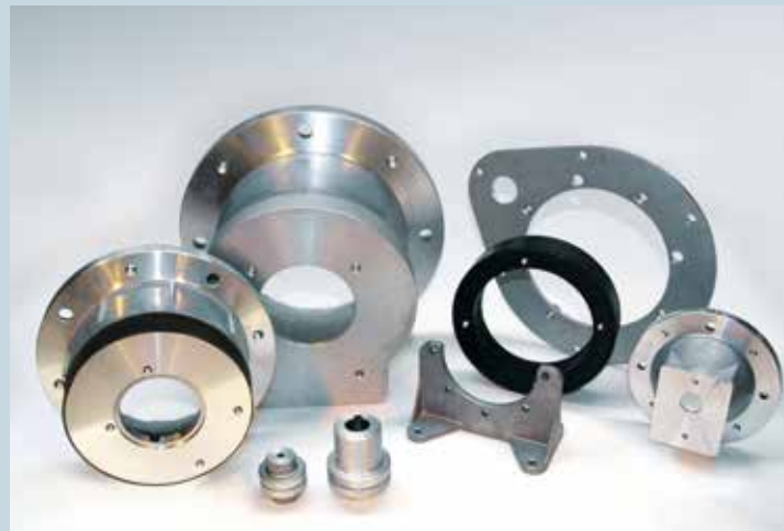
Pumpenträger und Kupplungen